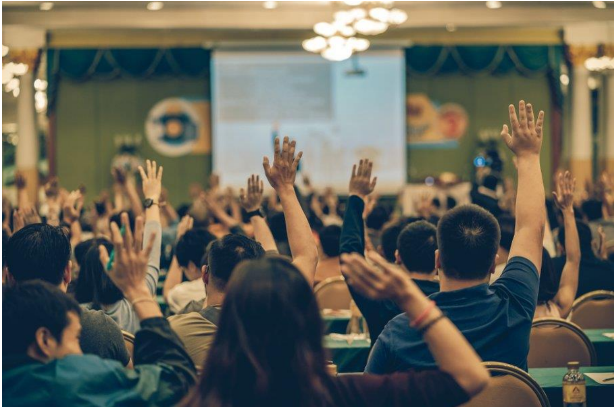
'Achteraanzicht van publiek' door TZIDO SUN (bron: Shutterstock)

Als ontwikkelende partij wil je voor zo min mogelijk verrassingen komen te staan gedurende de planontwikkeling en -uitvoering. Niet alleen een bestemmingsplan/omgevingsplan, maar ook ruimtelijke structuurvisies bieden kansen en beperkingen voor ontwikkelplannen. Daarvoor zijn grond- en woningbouwbeleid relevant, en eventueel ook het infrastructuurbeleid, natuur- en duurzaamheidsbeleid, economisch en soms zelfs toeristisch- of vrijetijdsbeleid. De uitvoering van nieuwe bouwprojecten heeft immers invloed op bijvoorbeeld bereikbaarheid, parkeren, natuur en milieu, en daarvoor gelden beperkende regels, maar soms ook stimulerende beleidsopvattingen. Afhankelijk van de invulling kunnen de ontwikkelplannen ook bijdragen aan de gemeentelijke behoeften aan wonen, werken en recreatie.