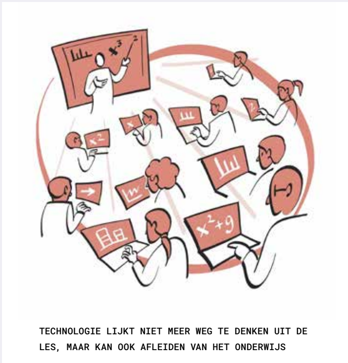
TECHNOLOGIE LIJKT NIET MEER WEG TE DENKEN UIT DE LES, MAAR KAN OOK AFLEIDEN VAN HET ONDERWIJS

[ILLUSTRATIES MARK VAN HUUSTEE IN SAMENWERKING MET ALEXANDRA DEN HEIJER – BRON: DEN HEIJER, 2021]