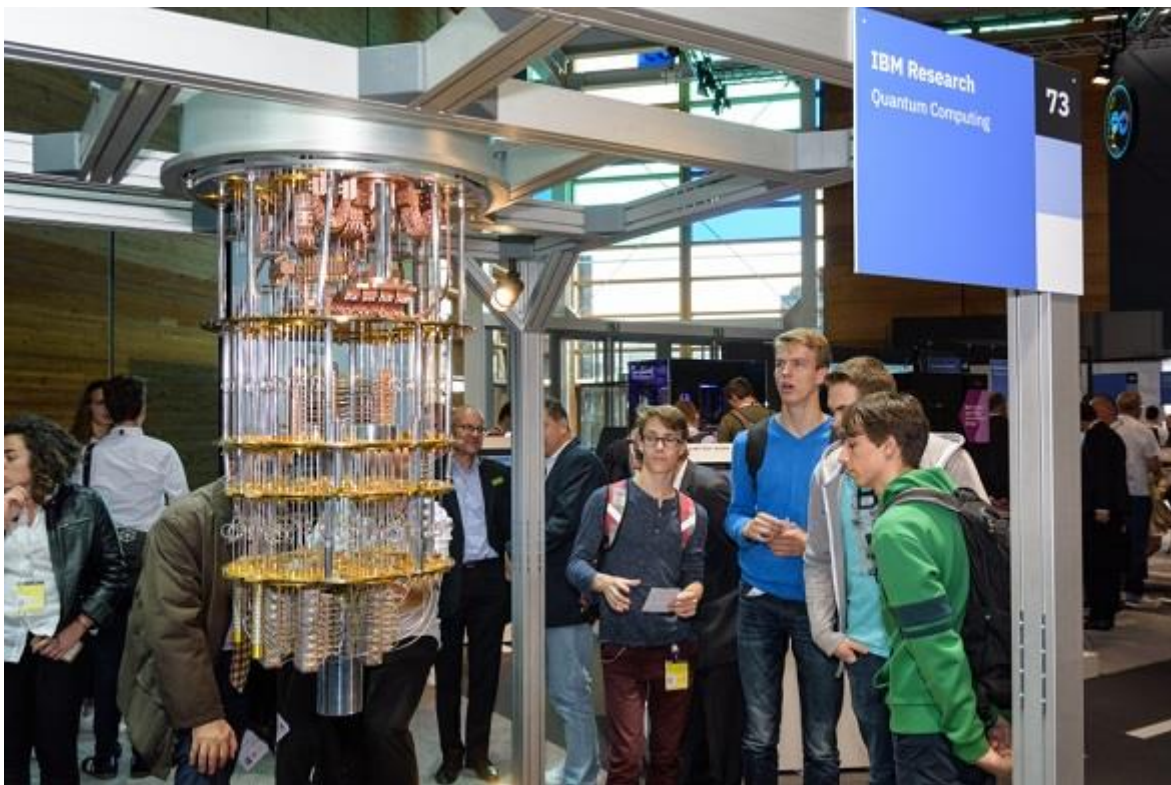
IBM toont een model van kwantumcomputer in hun paviljoen op Cebit 2018 in Hannover

De economische en nationale veiligheidsbelangen van Nederland worden beide gediend door snel toegang tot de eerste generaties van grotere operationele quantumcomputers. Het leveren van een sleutelbijdrage aan een Europees project voor het bouwen van deze quantumcomputers lijkt daarvoor het beste middel.