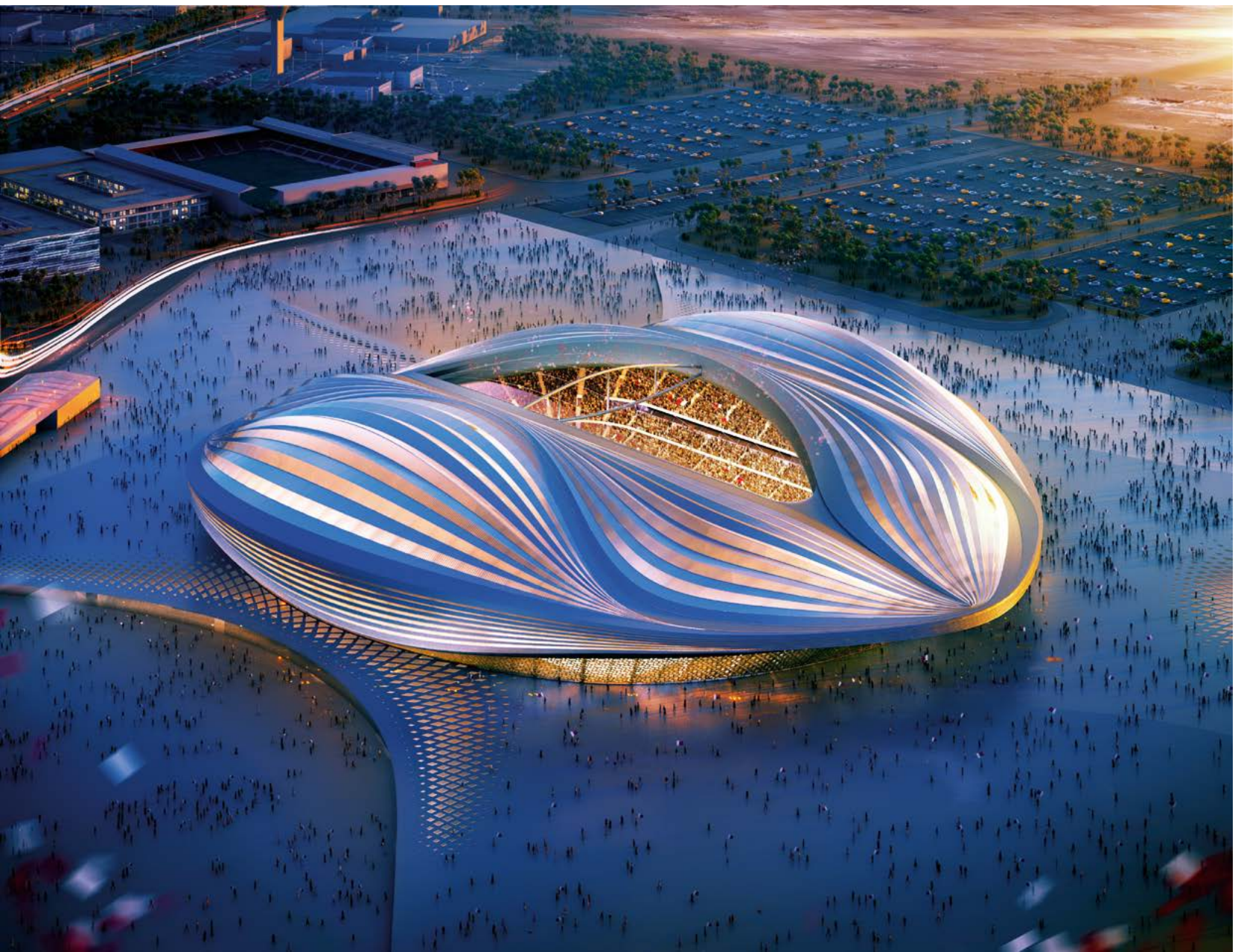
v Рис. 3: Стадион «Аль-Вакра» по проекту Захи Хадид / Al-Wakrah stadium by Zaha Hadid.

The storylines on migrant worker deaths and the sensually shaped stadium converged in late February 2014, when Hadid was speaking at the London Aquatics Centre. Asked about the migrant workers' conditions in Qatar, Hadid was quoted as having said something to the effect of dying migrant workers perhaps being a serious problem but