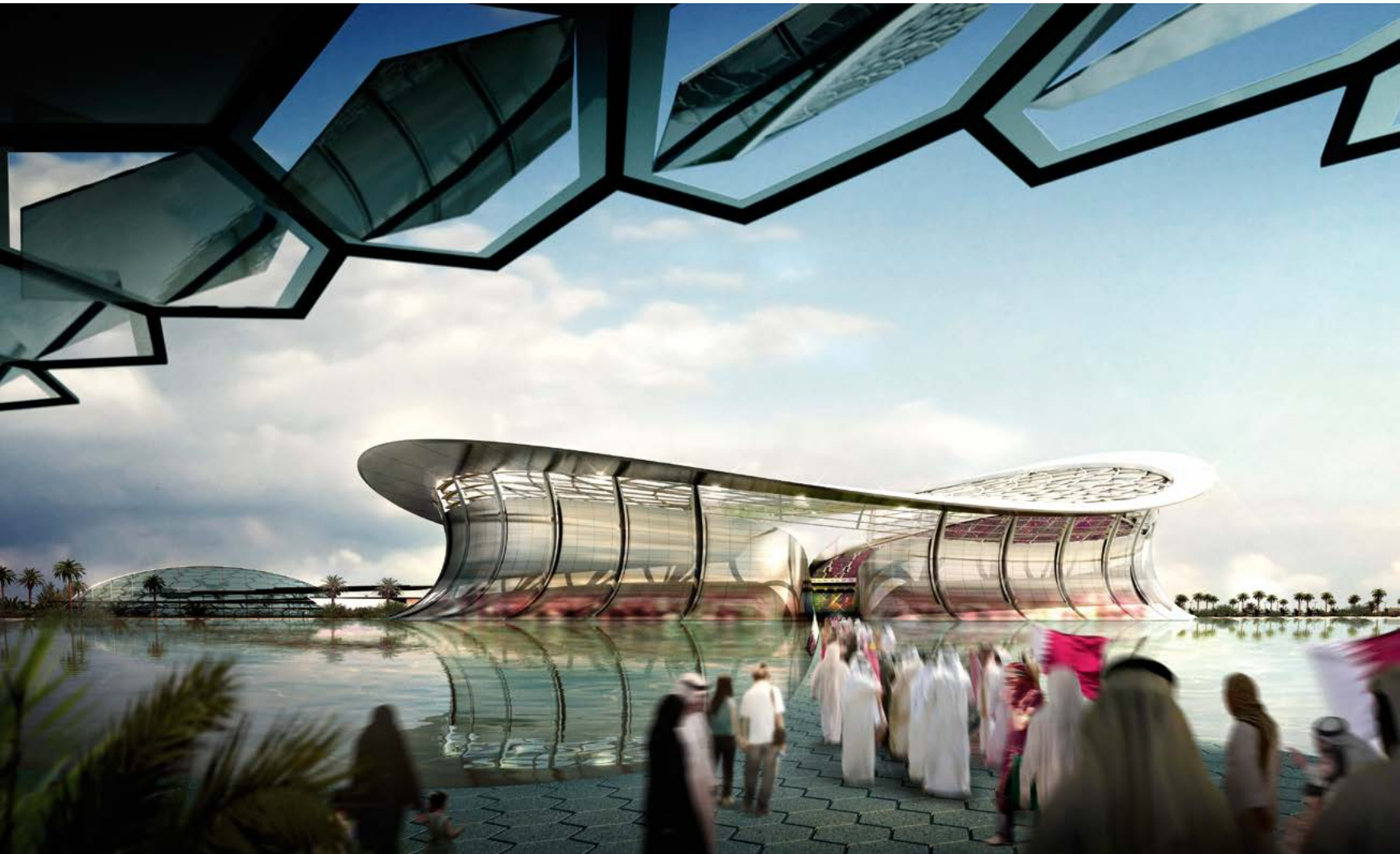
^ Рис. 5: Стадион в Лусаиле Нормана Фостера / Lusail stadium by Norman Foster

In 2011, the estimated age-specific death rate for males in Nepal in the age range 25–29 years was 2.2. For the age range 30–34 years this figure was 2.5 (Central Bureau of Statistics, 2014). Corresponding figures for India are 2.1 and 2.9, respectively (Open Government Data Platform India, 2016).