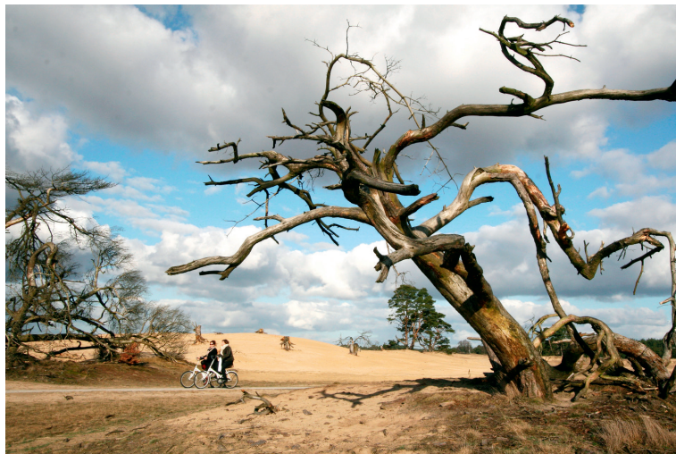
图1 梵高森林公园内骑行的参观者

在众多拥有城市荒野营造经验的国家中,荷兰具有一定代表性。荷兰是几乎由人工规划出来的国家,填海和堤坝工程造就了目前大部分国土 [24] 。在有限的国土面积和自然资源条件下,荷兰需要应对人口增长、高度城市化、基础设施压力和气候变化等挑战,因此在人居环境领域有诸多探索,包括创新及可持续性的城市空间规划、城市环境中自然式景观的营造等。我国对于荒野相关课题的探索正处于稳步发展阶段。虽然基本国情有所差别,但面临着高度城市化和景观空间高度人工控制等相似问题 [25] 。工作与生活压力也使公众对于城市中自然空间的需求增加,人类和自然的关系始终处于持续变化和潜在的不稳定中。因此,荷兰实践经验对于我国的城市荒野景观营造具有一定的借鉴性。