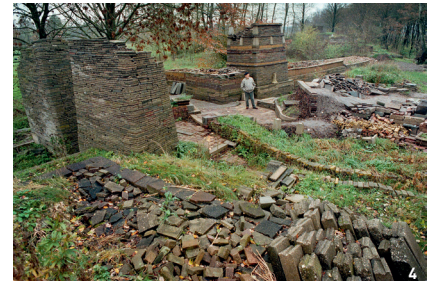
图4 勒罗伊在米尔丹的生态教堂

土地上(图4)。项目最初由当时身为艺术教师和生态主义者的“自然式花园理念之父”路易斯·勒罗伊(Louis le Roy)发起,旨在通过自然和创造性人为扰动之间的合作来发展复杂的生态结构,重建人与自然的联系 [37] 。