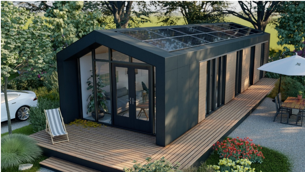
Figuur 4. De semi permanente flexwoningen van Uuthuske van de The New Makers B.V. zijn op tal van manieren te schakelen tot aantrekkelijke ensembles met toch een hoge dichtheid, bron: www.Uuthuske.nl