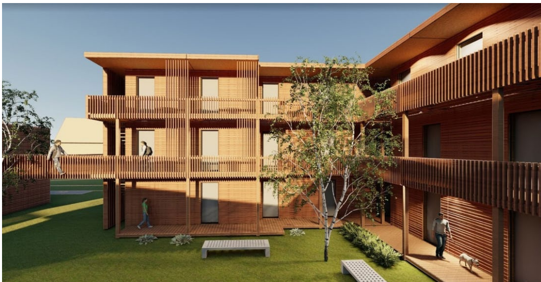
Figuur 3. Kandidaat Woonpionier 2021 van VPRO Tegenlicht De Kleine Duinvallei in Katwijk, semipermanente flexwoningen van Woodyshousing die er voor tien jaar staan. De levensduur van deze units is vijftig jaar.

'Een flexwoning voegt altijd een woning toe en vermindert zo het woningtekort. Het alternatief is dat de woningzoeker niets heeft. Flexwonen is wel voor mensen die beseffen dat het tijdelijk is. Maar veel alternatieven zijn er niet voor spoedzoekers. 'Wonen terwijl je wacht', is het eerder genoemd. Je wachttijd loopt doorgaans wel gewoon door. Het alternatief is namelijk géén woning. Dan moet je langer thuis blijven wonen, van ver weg blijven pendelen, bij vrienden logeren of soms zelfs op straat slapen.