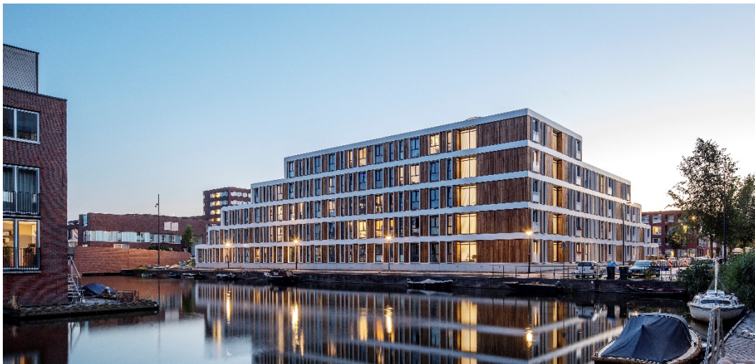
Figuur 2. VPRO Tegenlicht Woonpionier 2021 winnaar is het jongerenproject SET op IJburg Amsterdam van SVP architecten en De Alliantie. De semipermanente flexwoningen van Jan Snel staan er voor tien jaar.

Het ministerie van Binnenlandse Zaken en Koninkrijksrelaties definieert de term 'flexwonen' als flexibele woonoplossingen die relatief snel en goedkoop kunnen worden gerealiseerd. Kenmerkend is het 'tijdelijke karakter' van de woning zelf, de bewoning of het gebruik van een locatie waarop de woning wordt geplaatst. Het gaat hier om tijdelijke huurcontracten voor o.a. studenten en jongeren die een sloopflat bewonen, een kantoor dat leeg staat en dat wordt verbouwd voor doelgroepen voor een bepaalde periode en een leeg stuk grond waar de gebiedsontwikkeling moeizaam op gang komt waar units worden neergezet voor 10, dat kan worden opgerekt tot 15 jaar.'