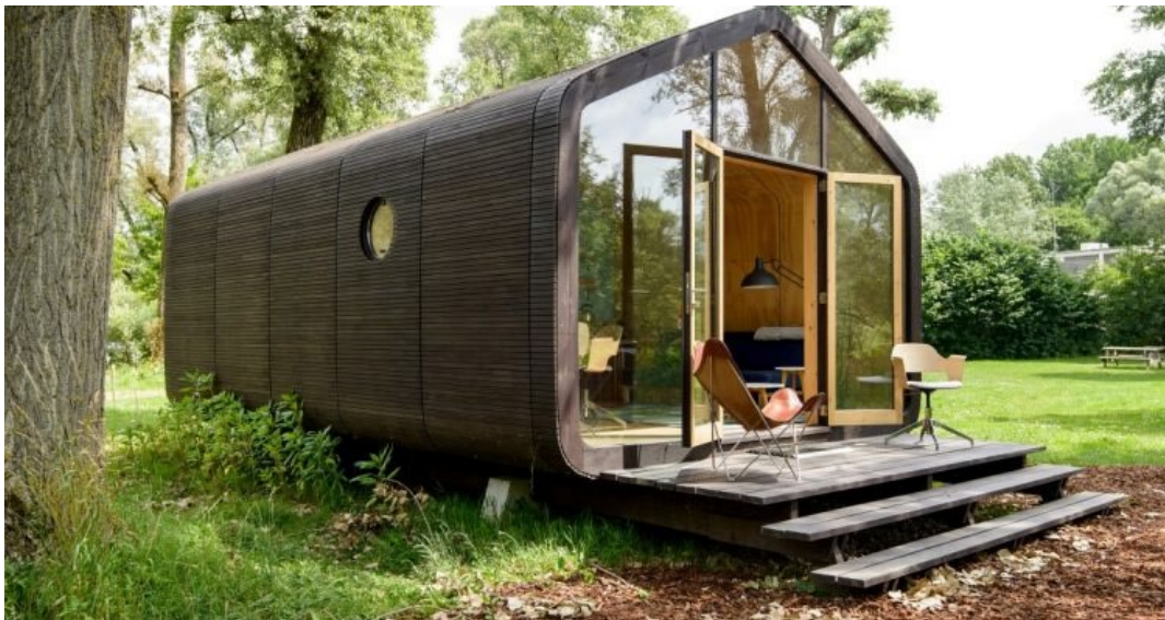
Figuur 5. Het semipermanente Wikkelhuis, een tiny House in de natuur en ver weg van de drukke stad. Studio BLOOM ontwerp & interieuradvies ontwierp een woody. met MINI-LIVING voor Salon del Mobile Milan.

'Peel Dorpen won de publieksprijs bij Woonpioniers van VPRO Tegenlicht. Het is niet ondenkbaar dat straks over Nederland verspreid overal circulaire modulaire woonunits of tiny houses of woodys worden gebouwd. Zeker als de CO 2 -beprijzing van staal en beton vanaf 2024 de traditionele woningbouw te kostbaar maakt. En agrarisch land getransformeerd wordt naar natuur en woongebieden met verspreid liggende houten woningen op voormalig boerenland.'