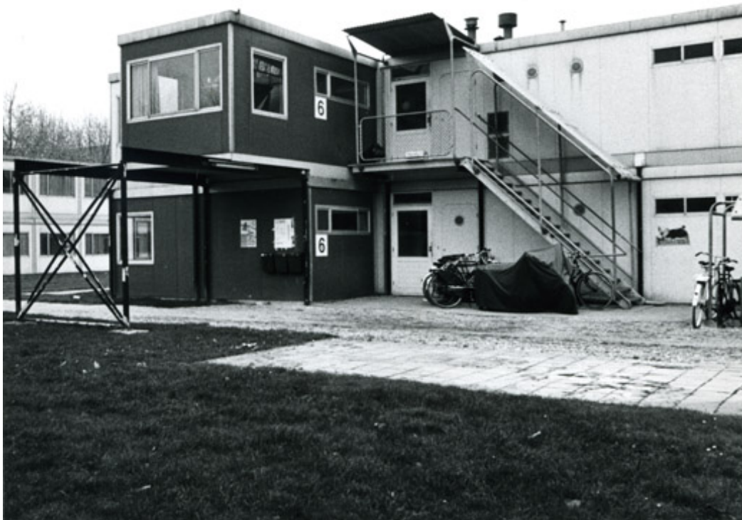
Figuur 1. Gimme Shelter, foto: Rook & Nagelkerke

Key words: flexibele huisvestingsschil, flexwonen, spoedzoekers, verplaatsbare woningen, modulaire woningen, woonunits, semipermanente woonvorm, camper